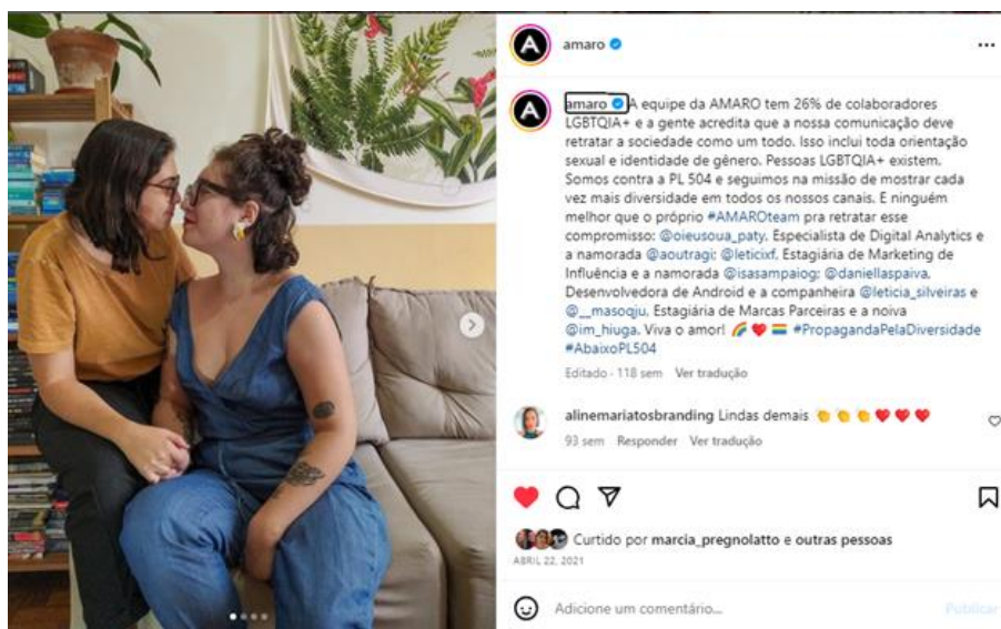
Figura 2: Postagem da Amaro de junho de 2020, com funcionárias e suas companheiras.

Fonte: Instagram da Amaro (@amaro), Online, 2020 10