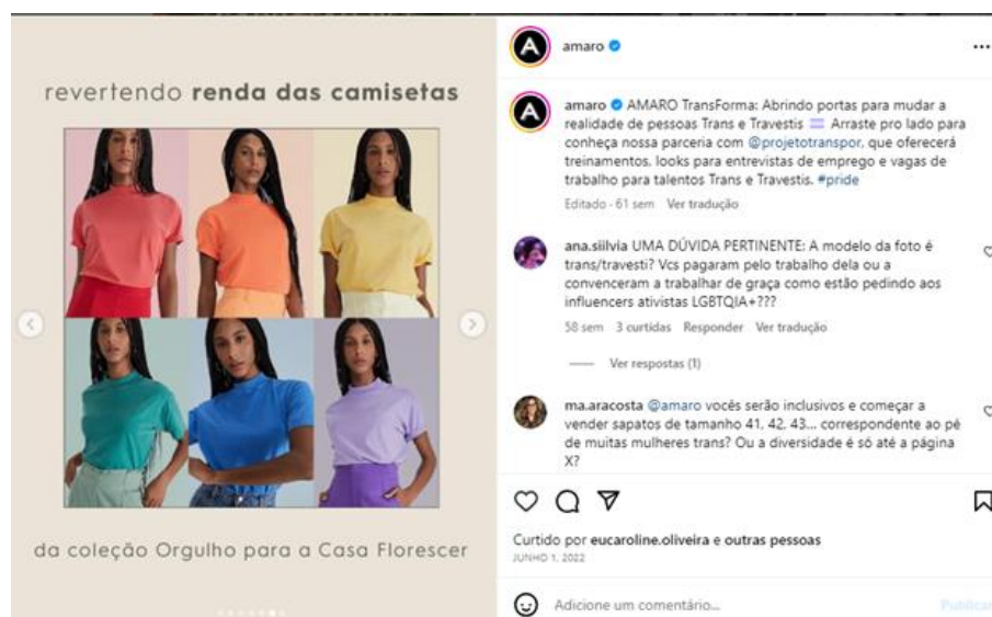
Figura 4: Postagem sobre o Projeto Amaro Transforma em apoio à Casa Florescer.

Fonte: Instagram da Amaro (@amaro), Online, 2022 13