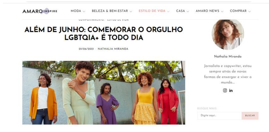
Figura 3: Publicação sobre a iniciativa com mulheres trans da Casa Florescer.

organização sem fins lucrativos que acolhe travestis e mulheres trans (Strazza, 2021). As mulheres da instituição fizeram parte de um editorial e de um vídeo manifesto 11 produzido pela marca naquele período, fazendo com que seus corpos ganhassem visibilidade como corpos inseridos no mercado de moda (imagem B da FIG. 1 e FIG. 3).