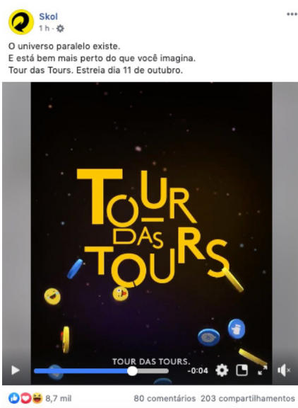
Figura 01: Campanha publicitária inspirada no grupo LDRV

É a partir da tour do cofre 7 , em 2017, que parece se tornar comum ver situações que acontecem no LDRV ganharem espaço em veículos midiáticos. Um exemplo demonstrativo é a recente campanha publicitária da Skol inspirada em tours 8 do grupo que, apropriando-se sobre discursos e ações interacionais dos membros, transformam-se em produtos comerciais. Esse tipo de apropriação revela um valor que é, sobretudo, mercadológico, a partir do que acontece e do que habita o imaginário do LDRV.