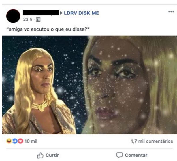
Figura 03: Tour no grupo

O que se sobressai é uma certa tendência na produção de conteúdos engraçados, incomuns, os quais são discursivamente colocados em circulação pelos atores. Ser inesperado é, portanto, uma situação que parte dos usos, mas principalmente de apropriações, e ecoa num tipo de comportamento. Pensando a partir do sistema de comunidade do grupo, esse é um dos resultados do próprio desafio da LDRV, afinal, ser inesperado é também sinônimo de ser original, e ser originalmente engraçado é um dos grandes objetivos no grupo.